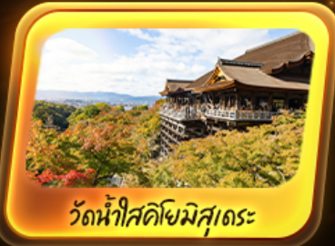
วัดน้ำใสคิโยมิสุเดอะ

จุดเช็คอินเที่ยวห้ามพลาด ปราสาทโอซาก้า และย่านเก่าฮอนชู ชิโนบุ ป๊อปปูล่าเบบ์นียงทวง นารา ขอบวัดโทโดจิ เรื่องราวสุดมหัศจรรย์วัดน้ำใสคิโยมิสุเดอะ Unseen ดินแดนแห่งชัยชนะ วัดคัตสึโอจิ ช้อปปิ้งจุใจละลายเงินเยนที่ Outlet ดัง