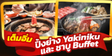
เต็มรับ ปิ้งย่าง Yakiniku และ ซาซุ Buffet