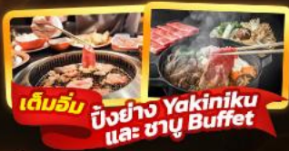
เต็มอิ่ม ปิ้งย่าง Yakiniku และ ชา-yu Buffet