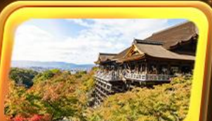
วัดน้ำใสคิโยมิสุเดระ