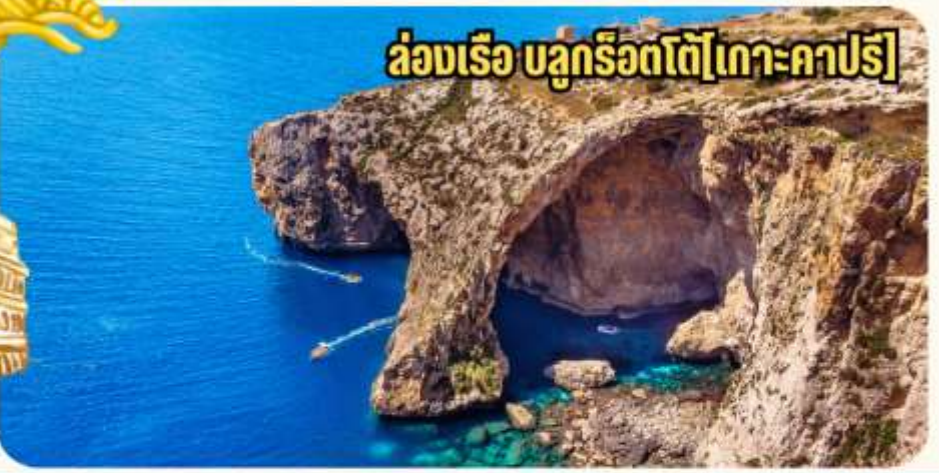
ล่องเรือ บลูกริโอตโต [เกาะคาปรี]