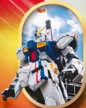
ห้างลาลาพอกทันดัม