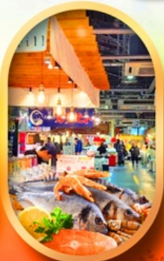
ตลาดปลาฮิงุชิ