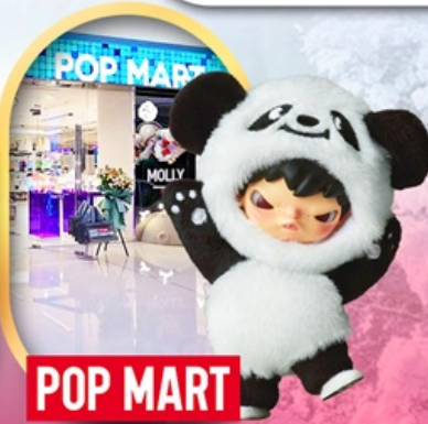
ช้อปบั้งร้าน Pop Mart