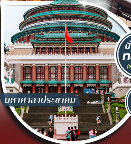
มหาศาลาประชาชน