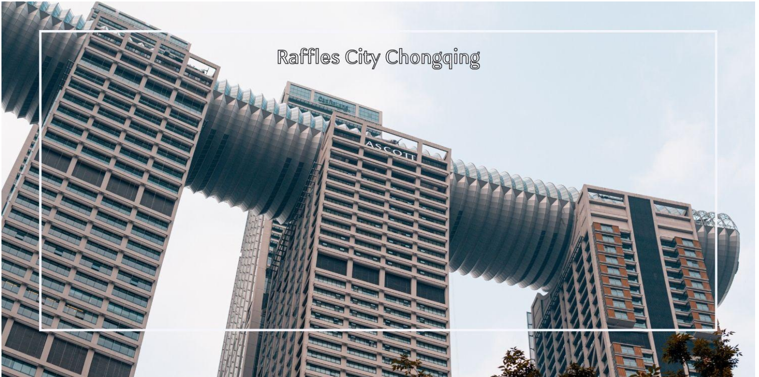
Raffles City Chongqing

นำท่านช้อปปิ้ง Raffles City Chongqing ภายในโครงการเป็นศูนย์การค้าขนาดใหญ่ที่ทันสมัย ครบครันด้วยร้านค้าแบรนด์นานาชาติ ร้านท้องถิ่น ร้านอาหาร และคาเฟ่หลากหลายรูปแบบ พื้นที่กว้างขวางให้บรรยากาศหรูหรา