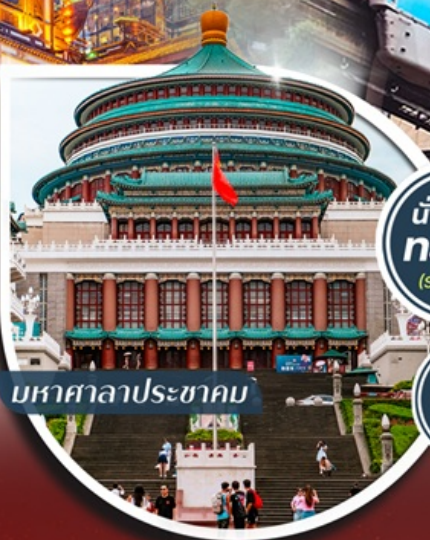
มหาศาลาประชาชน