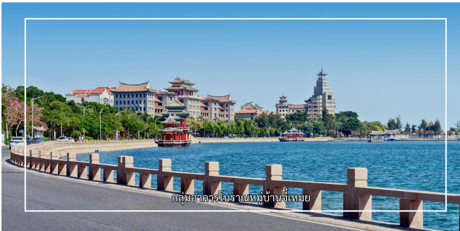
กลุ่มอาคารโบราณหมู่บ้านจีเหมย

นักธุรกิจและนักการศึกษาผู้มีชื่อเสียง ซึ่งมีบทบาทสำคัญในการพัฒนาพื้นที่จีเหมยให้เป็นศูนย์กลางด้านการศึกษา และวัฒนธรรม สถาปัตยกรรมของหมู่บ้านจีเหมยมีลักษณะเฉพาะ เรียกว่า “สไตล์จีเหมย” ซึ่งเป็นการผสมผสานระหว่างศิลปะจีนดั้งเดิมกับอิทธิพลตะวันตก หลังคาทรงจีน ผนังอิฐสีอ่อน ชุ่มประตู่ และรายละเอียดการตกแต่งที่ประณีต สะท้อนถึงความงดงามและคุณค่าทางประวัติศาสตร์อย่างชัดเจน พื้นที่ภายในประกอบด้วยอาคารเรียน วัด ศาลา และบ้านพักที่จัดวางอย่างเป็นระเบียบ สอดคล้องกับภูมิทัศน์โดยรอบ