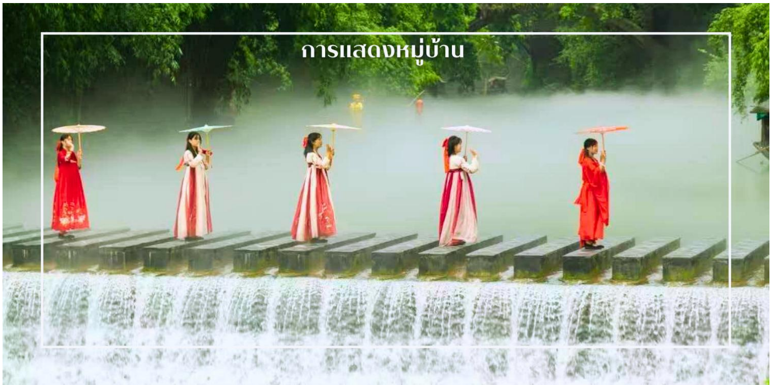
การแสดงหมู่บ้าน

พร้อมให้ท่านได้ชมการแสดงเรื่องราวเกี่ยวกับวิถีชีวิตควบคู่กับสายน้ำ การแสดงในครั้งนี้จะถ่ายทอดเรื่องราวความเป็นอยู่ ความเชื่อ และประเพณีของผู้คนในชุมชน ผ่านศิลปะการแสดงที่ผสมผสานความอ่อนช้อยและความมีชีวิตชีวา