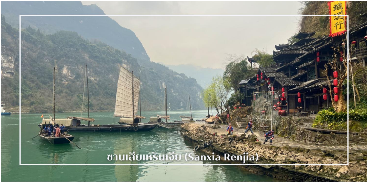
ซานเสี่ยวเหรินเจีย (Sanxia Renjia)

พร้อมให้ท่านได้ชมการแสดงเรื่องราวเกี่ยวกับวิถีชีวิตควบคู่กับสายน้ำ การแสดงในครั้งนี้จะถ่ายทอดเรื่องราวความเป็นอยู่ ความเชื่อ และประเพณีของผู้คนในชุมชน ผ่านศิลปะการแสดงที่ผสมผสานความอ่อนช้อยและความมีชีวิตชีวา