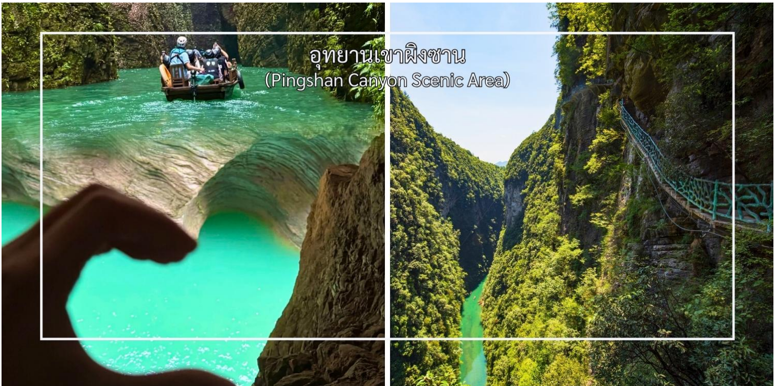
อุทยานเขาผิงซาน (Pingshan Canyon Scenic Area)

นำท่านสัมผัสความยิ่งใหญ่ที่เทียบระดับ 4A ที่ อุทยานเขาผิงซาน(Pingshan Canyon Scenic Area) หรือที่นักท่องเที่ยวรู้จักในชื่อ โกรกรูปหัวใจ (Heart-Shaped Gorge) เป็นหนึ่งในแลนด์มาร์กธรรมชาติที่สวยงามและมีเอกลักษณ์สวยงามด้วยรูปทรงโกรกที่คล้ายหัวใจซึ่งเกิดจากการกัดเซาะของสายน้ำและกระบวนการทางธรณีวิทยามายาวนาน ทำให้กลายเป็นจุดชมวิวที่โรแมนติกและเหมาะแก่การถ่ายภาพ ท่านสามารถเดินชมเส้นทางธรรมชาติรอบโกรก หรือมองจากจุดชมวิวสูงเพื่อเห็นภาพโกรกรูปหัวใจอย่างเต็มตา นอกจากความสวยงามแล้ว บริเวณนี้ยังเต็มไปด้วยธรรมชาติอันอุดมสมบูรณ์ ทั้งป่าไม้ ลำธาร และสัตว์ป่าที่อาศัยอยู่ในพื้นที่ ทำให้เป็นจุดหมายที่ผสมผสานทั้งความงดงามและความสงบแห่งธรรมชาติ (รวมล่องเรือ)