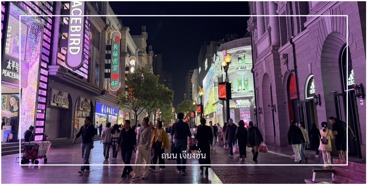
ถนน เจียงอัน

นำท่านชม สะพานข้ามแม่น้ำแยงซีเกียงแห่งแรกของประเทศจีน (Wuhan Yangtze River Bridge) สะพานสำคัญที่เชื่อมระหว่างฝั่งอันไห่วและอู่ชาง สร้างขึ้นในปี ค.ศ. 1957 และถือเป็นหนึ่งในสัญลักษณ์ของการพัฒนาโครงสร้างพื้นฐานของจีนในยุคใหม่ ตัวสะพานเป็นโครงสร้าง 2 ชั้น สำหรับการสัญจรของรถยนต์และรถไฟ บริเวณนี้ยังเป็นจุดชมวิวที่สามารถมองเห็นแม่น้ำแยงซีเกียงและทัศนียภาพของเมืองอู่ชางได้อย่างสวยงาม โดยเฉพาะในช่วงค่ำคืนที่แสงไฟของเมืองส่องสะท้อนกับสายน้ำ สร้างบรรยากาศที่น่าประทับใจ