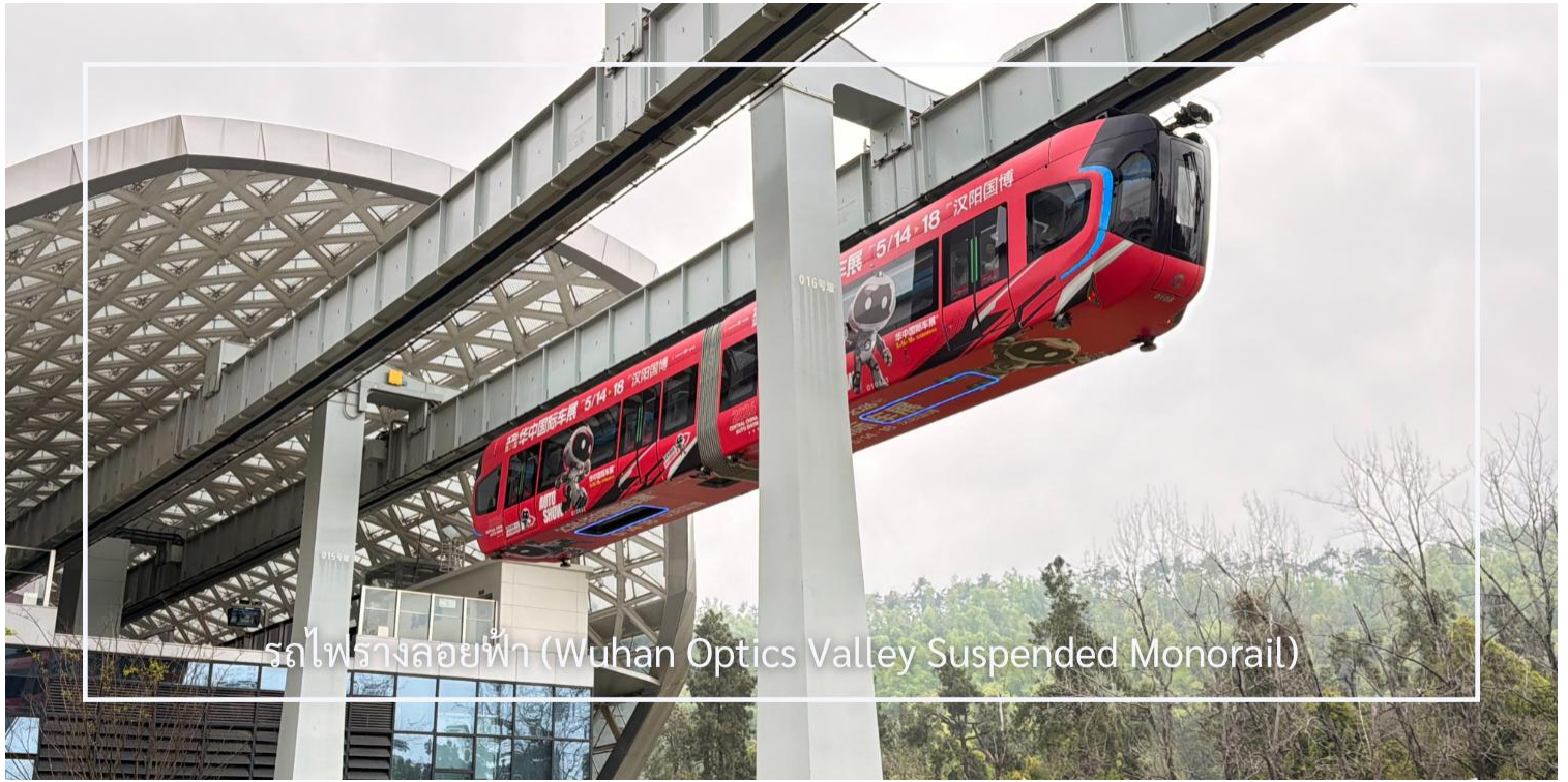
รถไฟรางลอยฟ้า (Wuhan Optics Valley Suspended Monorail)

นำท่านสู่ ห้าง Wushang Dream Plaza Mall แลนด์มาร์กช้อปปิ้งขนาดใหญ่ของเมืองอู่ฮั่น ที่รวมทุกไลฟ์สไตล์ไว้ในที่เดียว ภายในรวบรวมสินค้าแฟชั่น เครื่องประดับ ของฝาก และแบรนด์ชั้นนำมากมาย ให้ท่านได้เลือกชมและเลือกซื้อสินค้าอย่างเพลิดเพลิน พร้อมสิ่งอำนวยความสะดวกและโซนความบันเทิงครบครัน อาทิ สนามขี่ม้า สวนสนุกในร่ม ศูนย์เกม และโชว์รูมรถยนต์ และเทคโนโลยีต่าง ๆ เสมือนยกทั้งเมืองแห่งความสุขและไลฟ์สไตล์มาไว้ภายในห้างเดียว ให้ท่านอิสระตามอัธยาศัย