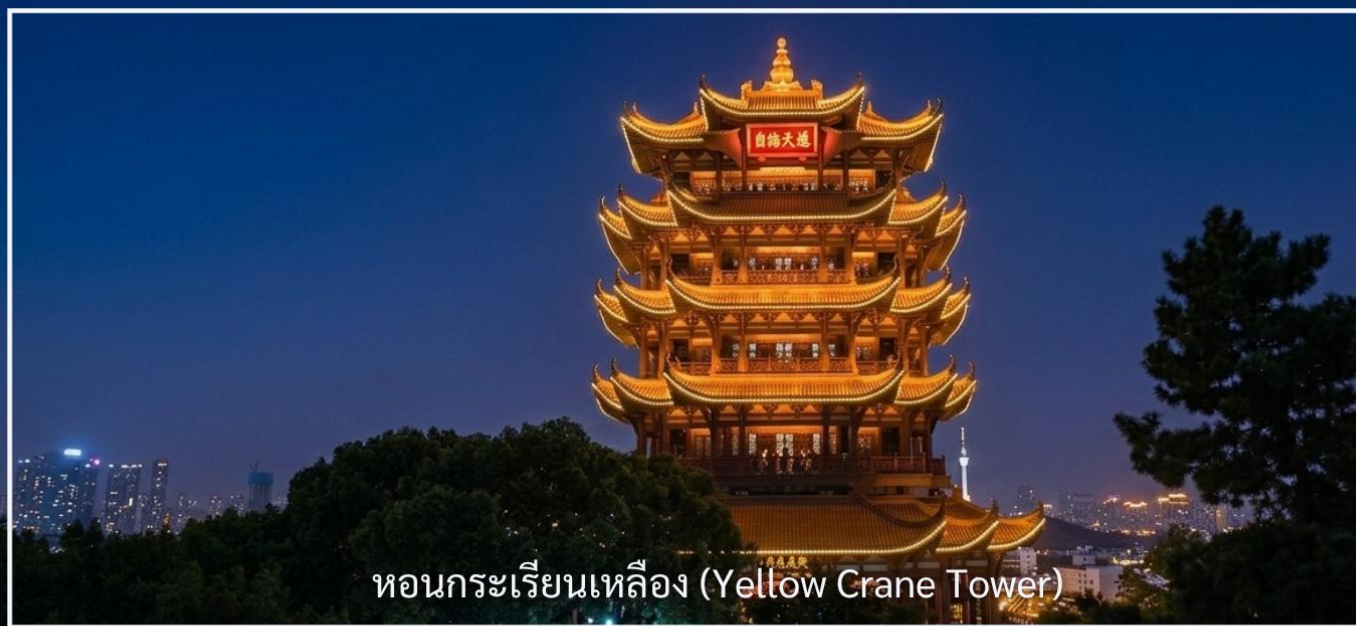
หอนกระเรียนเหลือง (Yellow Crane Tower)

จีนโบราณอันงดงามและสง่างาม หอแห่งนี้มีความสำคัญทั้งในด้านประวัติศาสตร์ วัฒนธรรม และวรรณกรรม โดยปรากฏอยู่ในบทกวีจีนโบราณหลายบท และถือเป็นหนึ่งในสี่หอคอยที่มีชื่อเสียงที่สุดของจีน