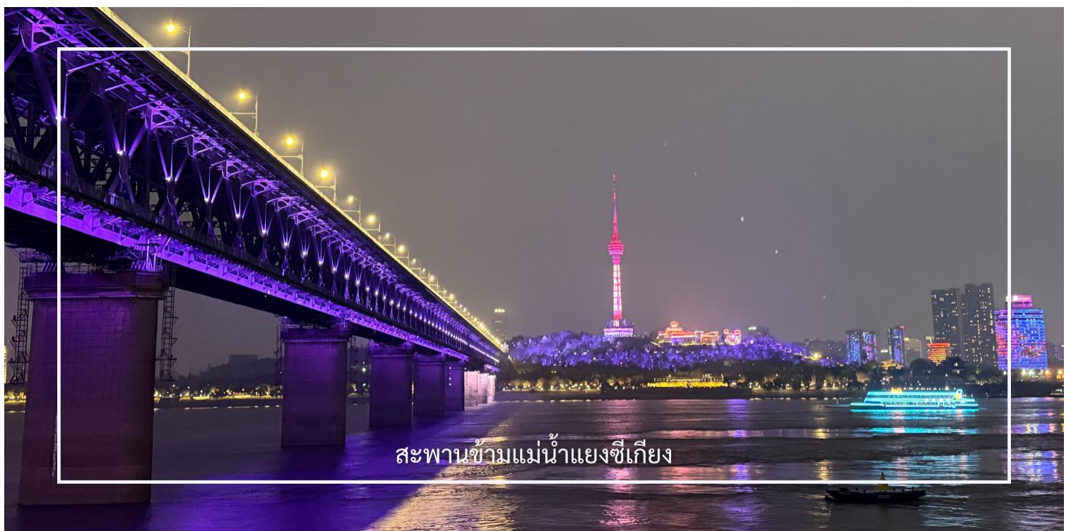
สะพานข้ามแม่น้ำแยงซีเกียง

นำท่านชม สะพานข้ามแม่น้ำแยงซีเกียงแห่งแรกของประเทศจีน (Wuhan Yangtze River Bridge) สะพานสำคัญที่เชื่อมระหว่างฝั่งอันไห่วและอู่ชาง สร้างขึ้นในปี ค.ศ. 1957 และถือเป็นหนึ่งในสัญลักษณ์ของการพัฒนาโครงสร้างพื้นฐานของจีนในยุคใหม่ ตัวสะพานเป็นโครงสร้าง 2 ชั้น สำหรับการสัญจรของรถยนต์และรถไฟ บริเวณนี้ยังเป็นจุดชมวิวที่สามารถมองเห็นแม่น้ำแยงซีเกียงและทัศนียภาพของเมืองอู่ชางได้อย่างสวยงาม โดยเฉพาะในช่วงค่ำคืนที่แสงไฟของเมืองส่องสะท้อนกับสายน้ำ สร้างบรรยากาศที่น่าประทับใจ