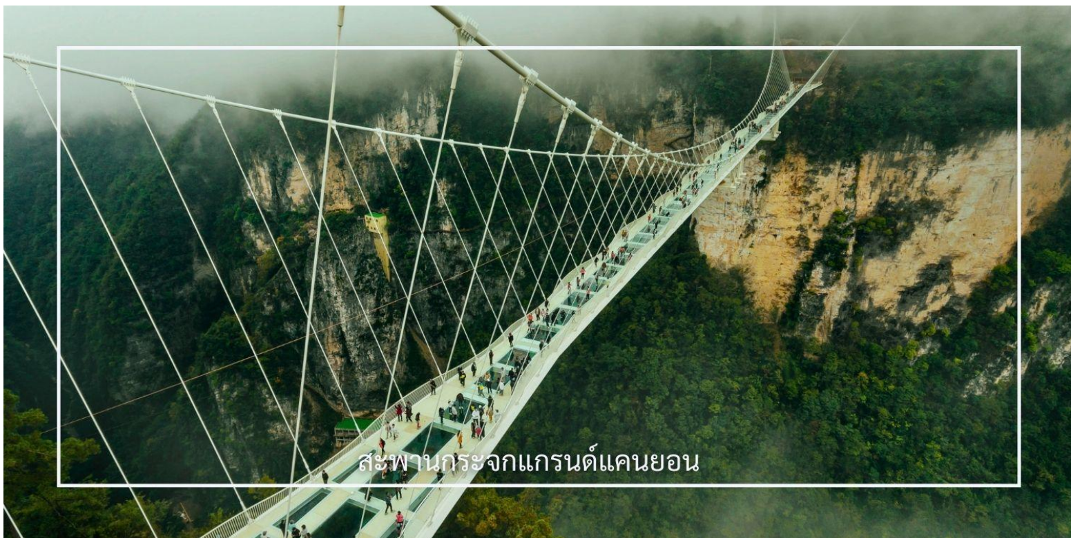
สะพานกระจกแกรนด์แคนยอน

ท่านสามารถเลือกซื้อบริการเสริม (Option) เพิ่มเติมได้: สะพานกระจกแกรนด์แคนยอน 400 หยวน/ท่าน สัมผัสประสบการณ์สุดตื่นเต้นกับการเดินบนสะพานกระจกใส ที่ทอดยาวเหนือหุบเขาสูง ให้ท่านได้ชมทัศนียภาพอันงดงาม แบบพาโนรามา พร้อมท้าทายความกล้าท่ามกลางบรรยากาศธรรมชาติอันยิ่งใหญ่