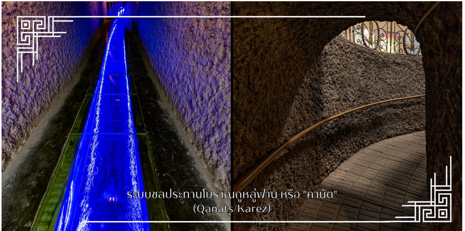
ระบบชลประทานโบราณคูหลู่ฟาน หรือ "คานัต" (Qanats/Karez)

ระบบชลประทานโบราณคูหลู่ฟาน หรือ “คานัต” เป็นระบบส่งน้ำใต้ดิน ในเขตซินเจียง ประเทศจีน ใช้ภูมิปัญญาชุดอุโมงค์ ใต้ดินเชื่อมต่อกัน เพื่อนำน้ำจากหิมะละลายบนภูเขามาใช้ในโอเอซิสทะเลทราย ลดการระเหยของน้ำ ทำให้เมืองคูหลู่ฟาน อุดมสมบูรณ์และเป็นแหล่งปลูกองุ่นขึ้นชื่อ