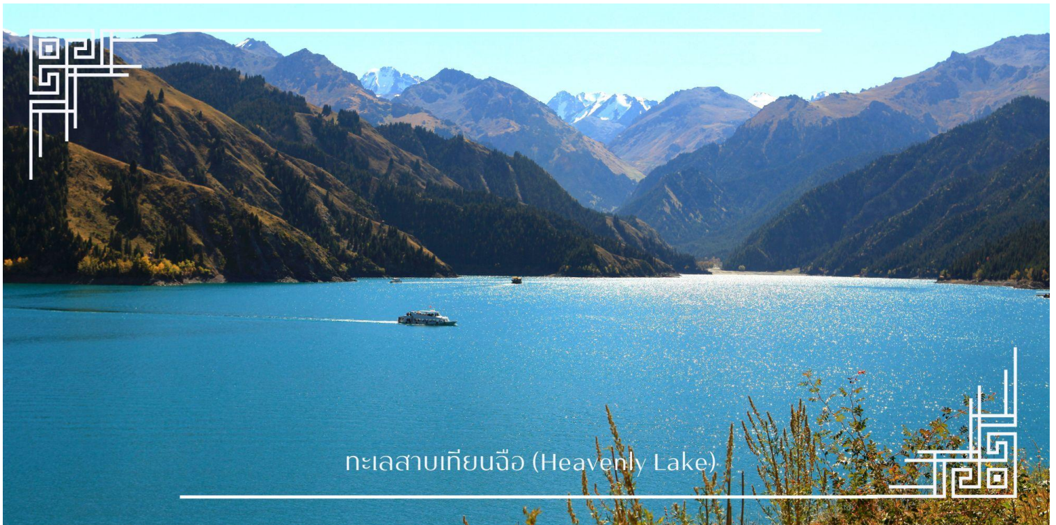
ทะเลสาบเทียนฉือ (Heavenly Lake)

นำท่าน ล่องเรือทะเลสาบเทียนฉือ (Heavenly Lake) ทะเลสาบน้ำจืดใสสะอาดราวกับกระจกเงา ท่ามกลางบรรยากาศเงียบสงบและอากาศอันบริสุทธิ์ ท่านจะได้ชมความยิ่งใหญ่ของยอดเขาที่สะท้อนเงาลงบนผืนน้ำสีมรกตอย่างใกล้ชิด มอบความรู้สึกที่ผ่อนคลายและประทับใจราวกับได้หลุดเข้าไปอยู่ในภาพวาดทิวทัศน์ระดับโลก (รวมค่าล่องเรือ)