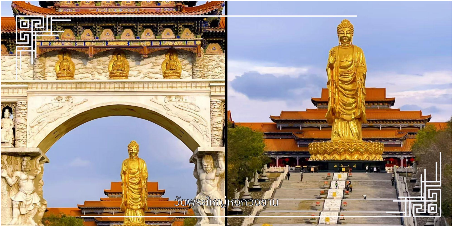
วัดพระใหญ่หงกวงซาน

หมายเหตุ : การล่องเรือเปิดให้บริการเฉพาะในช่วงเดือนพฤษภาคม – กันยายน ของทุกปี สำหรับเดือนเมษายน จะงดให้บริการล่องเรือ ทางบริษัทฯ ขอคืนเงินให้ท่านละ 450 บาท และปรับเปลี่ยนรายการนำท่านเดินทางไปสักการะพระใหญ่ ณ วัดพระใหญ่หงกวงซาน แทน