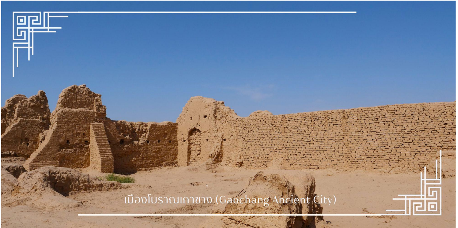
เมืองโบราณเกาซาง (Gaochang Ancient City)

นำท่านผ่านชม ภูเขาเปลวไฟ เป็นทิวเขาทรายสีแดงที่ร้อนที่สุดในจีน ขึ้นชื่อจากตำนานไซอิ๋วและวิวทิวทัศน์คล้ายดาวอังคารที่สวยแปลกตา ภูเขาทอดยาวเต็มไปด้วยหินสีแดงจัดเมื่อสะท้อนแสงแดดจะดูเหมือนเปลวเพลิง