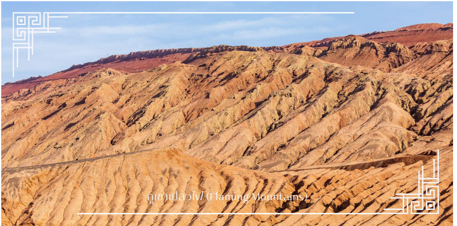
ภูเขาเปลวไฟ (Flaming Mountains)

นำท่านผ่านชม ภูเขาเปลวไฟ เป็นทิวเขาทรายสีแดงที่ร้อนที่สุดในจีน ขึ้นชื่อจากตำนานไซอิ๋วและวิวทิวทัศน์คล้ายดาวอังคารที่สวยแปลกตา ภูเขาทอดยาวเต็มไปด้วยหินสีแดงจัดเมื่อสะท้อนแสงแดดจะดูเหมือนเปลวเพลิง