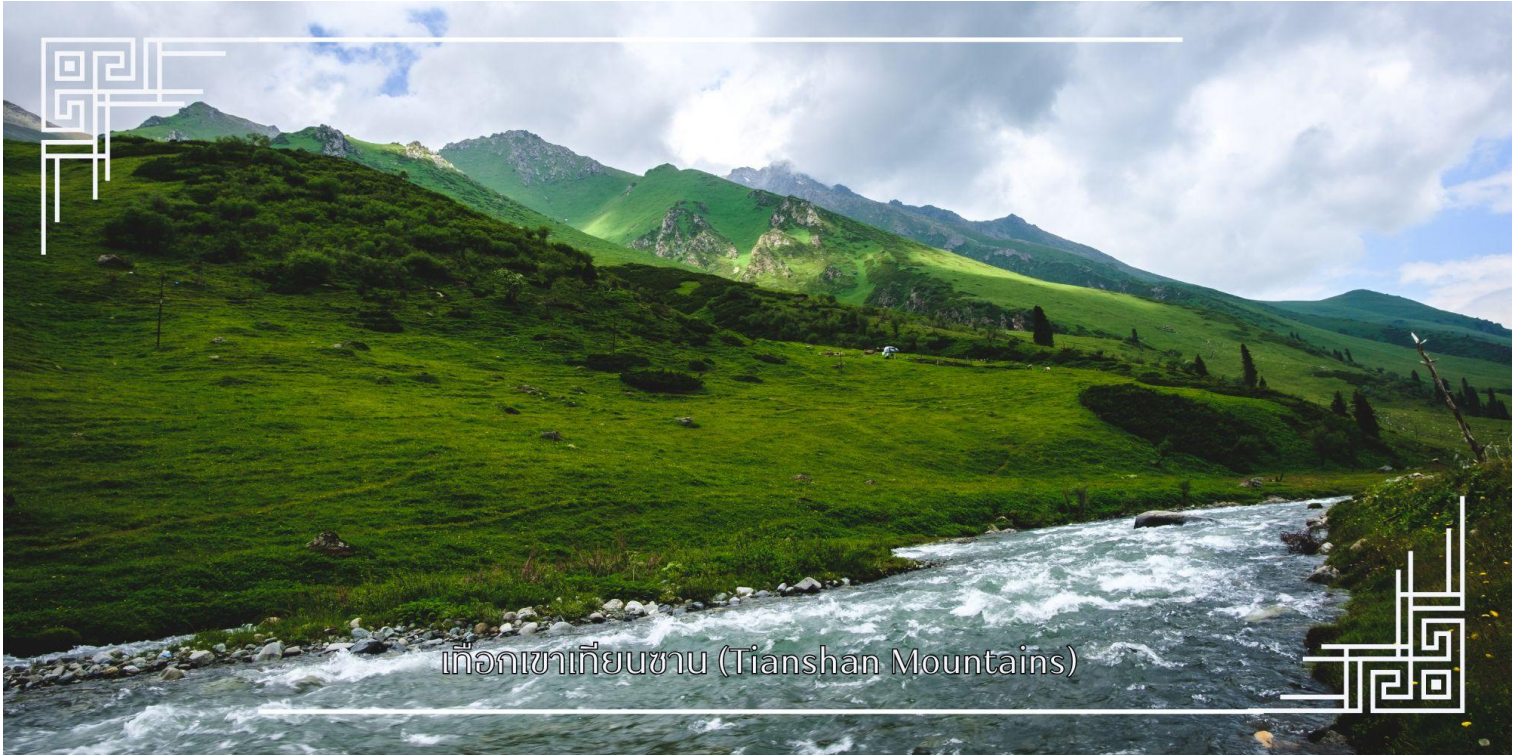
เทือกเขาเทียนชาน (Tianshan Mountains)