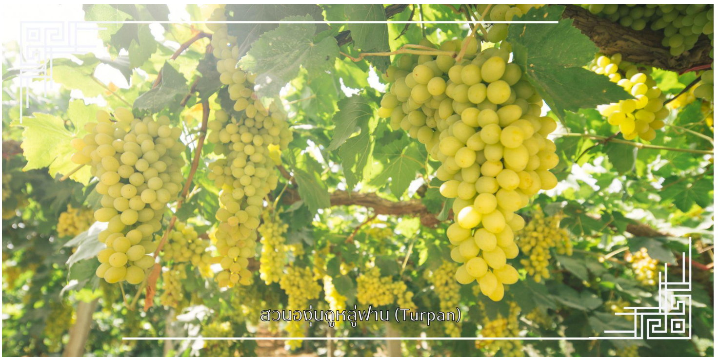
สวนองุ่นคูหลู่ฟาน (Turpan)

นำท่านแวะชม สวนองุ่น (มีเฉพาะเดือนมิถุนายน-สิงหาคม) แหล่งผลิตองุ่นไร้เมล็ดที่หวานและใหญ่ที่สุดของจีน ในหุบเขาที่ ร่มรื่นไปด้วยเถาองุ่นสีเขียวขจี ท่ามกลางบรรยากาศร่มรื่นกลางทะเลทราย