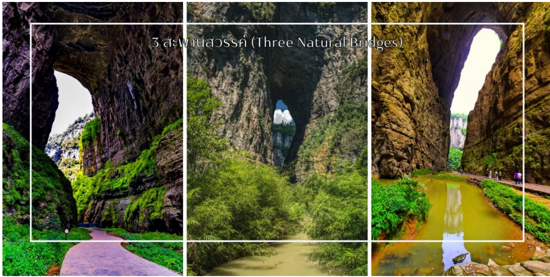
3 สะพานสวรรค์ (Three Natural Bridges)

ชมระเปียงแก้ว (Glass Skywalk) (รวมค่าระเปียงแก้ว) ในอุทยานแห่งชาติเทียนเซิงชานเฉียว เป็นหนึ่งในจุดท่องเที่ยวที่น่าตื่นตาตื่นใจและมีชื่อเสียงอย่างมากในประเทศจีน สร้างขึ้นบนหน้าผาสูงซึ่งมองลงไปเห็นวิวทิวทัศน์ที่สวยงามของภูเขาและหุบเขาโดยรอบ ทำให้ผู้เข้าชมรู้สึกเหมือนเดินอยู่บนอากาศ