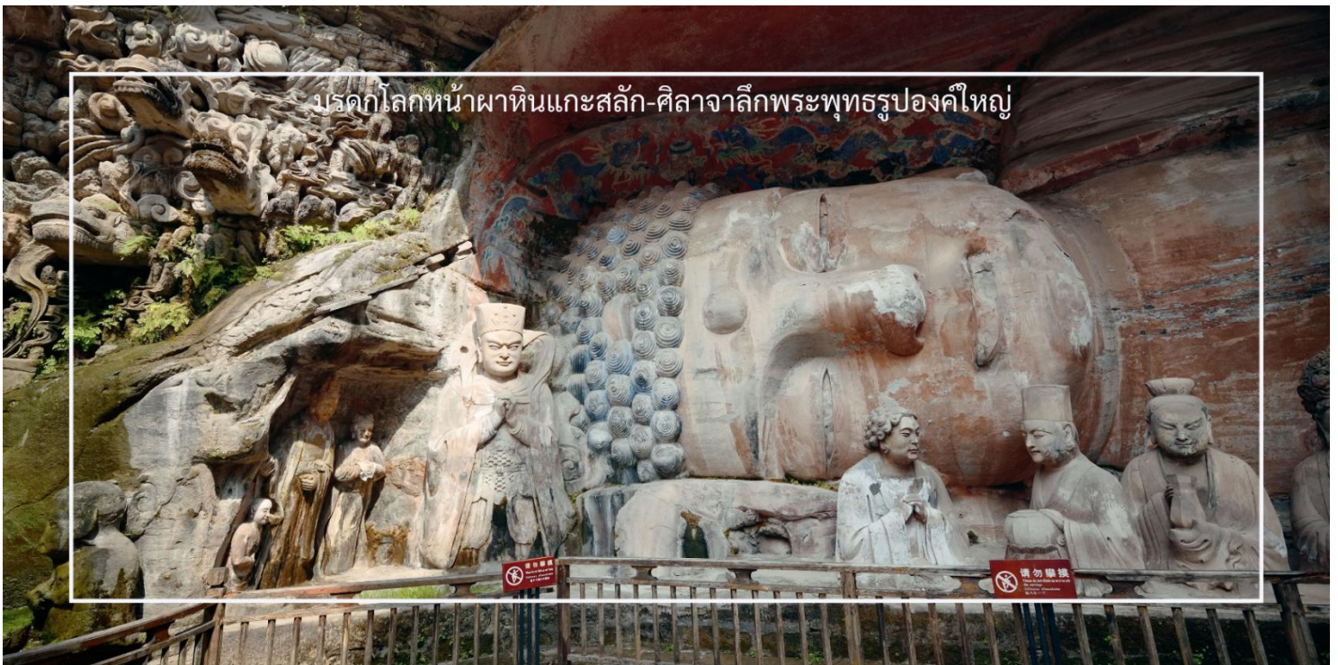
มรดกโลกหน้าผาทินแกะสลัก-ศิลาจารึกพระพุทธรูปองค์ใหญ่