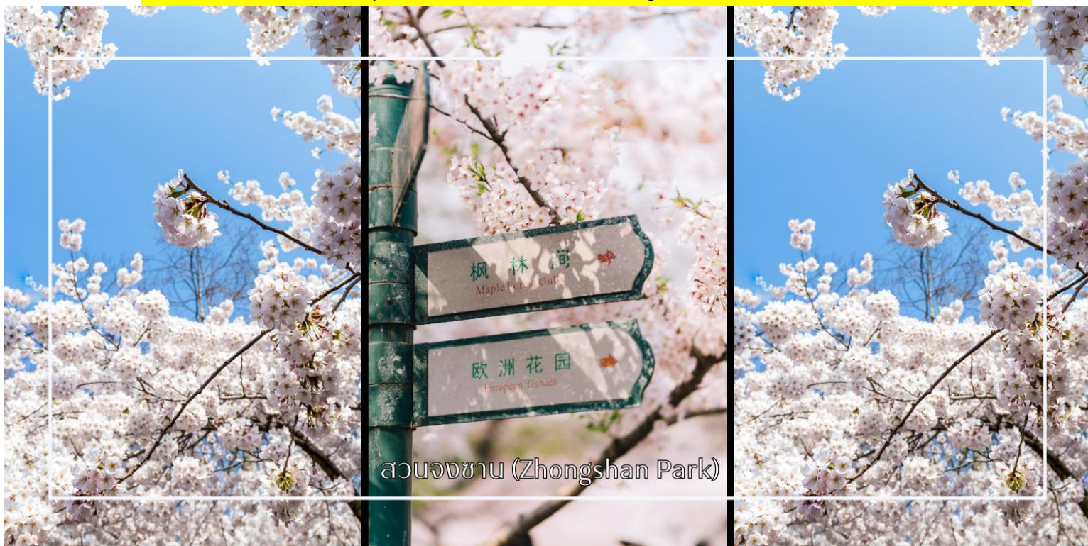
สวนจงซาน (Zhongshan Park)

หมายเหตุ: การบานของดอกซากุระขึ้นอยู่กับสภาพอากาศในแต่ละปีเป็นสำคัญ ทางบริษัทฯ ไม่สามารถรับประกันได้ว่าในช่วงวันเดินทางดอกซากุระจะบานมากหรือน้อย ทั้งนี้ขึ้นอยู่กับสภาพอากาศและธรรมชาติ ณ ช่วงเวลานั้น