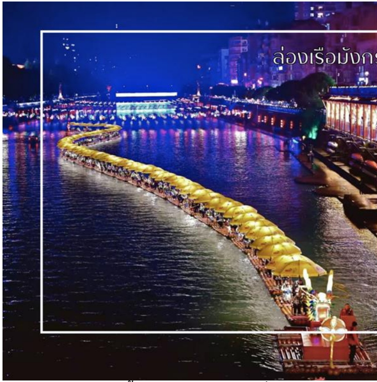
ล่องเรือมังกรแม่น้ำก้งสู่ย