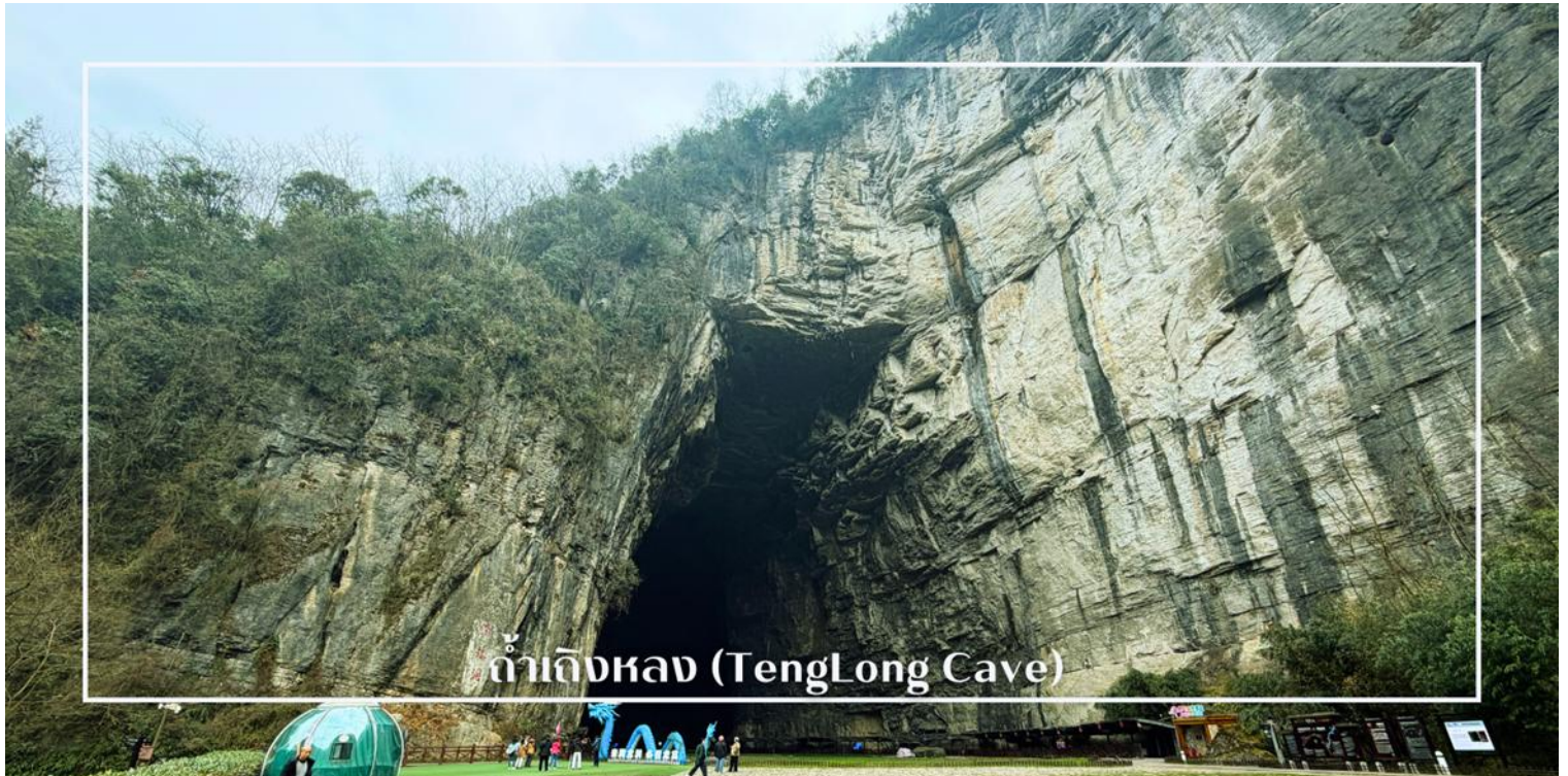
ถ้ำเถิงหลง (TengLong Cave)

นำท่านสู่ ถ้ำเถิงหลง (TengLong Cave) สถานที่ท่องเที่ยวระดับ 5A หนึ่งในถ้ำหินปูนที่ใหญ่และงดงามที่สุดของจีน ได้รับการขนานนามว่าเป็น ราชานแห่งถ้ำคาสต์ ด้วยความอลังการของธรรมชาติที่ก่อกำเนิดมากกว่า 300 ล้านปี ตัวถ้ำมีความยาวมากกว่า 50 กิโลเมตร แบ่งออกเป็นถ้ำแห้งและถ้ำเปียก ภายในเต็มไปด้วยหินงอกหินย้อยรูปร่างแปลกตา โถงถ้ำสูงใหญ่โอ่อ่า มีลำธารใสไหลผ่านกลางถ้ำ ตลอดเส้นทางยังมีการจัดแสงสีตระการตา เพิ่มบรรยากาศเสมือนเดินทางอยู่ในดินแดนแฟนตาซี