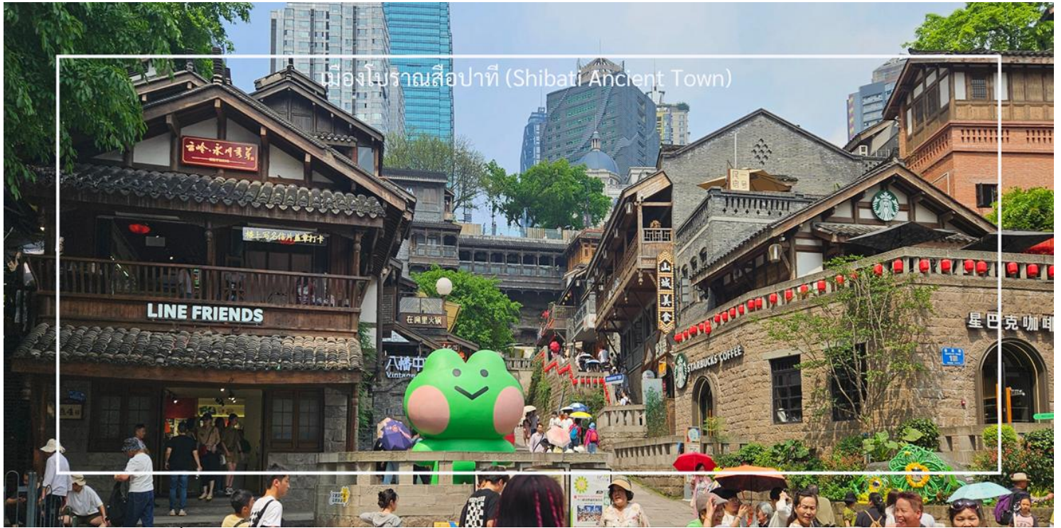
เมืองโบราณสื่อปาตี (Shibati Ancient Town)

จากนั้นนำทุกท่าน ชมเสน่ห์ย่านเก่าแก่ ถนนโบราณเซี่ยฮาว (Xiahao Old Street) ย่านเมืองเก่าใจกลางมหานคร ฉงชิ่งที่เต็มไปด้วยกลิ่นอายของอดีตผสานกับวิถีชีวิตปัจจุบันอย่างลงตัว ที่นี่เคยเป็นย่านการค้าสำคัญในอดีต ปัจจุบันได้รับการอนุรักษ์และปรับปรุงให้กลายเป็นสถานที่ท่องเที่ยวเชิงวัฒนธรรมที่มีชีวิตชีวา สองฝั่งถนนเรียงรายไปด้วยอาคารเก่าแก่สไตล์จีนโบราณ สลับกับคาเฟ่ มีร้านขายของพื้นเมือง ร้านหนังสือ และมุมถ่ายภาพ ที่ตกแต่งอย่างมีเอกลักษณ์ ท่ามกลางบรรยากาศอบอุ่นของชุมชนเก่าแก่ริมแม่น้ำแยงซี