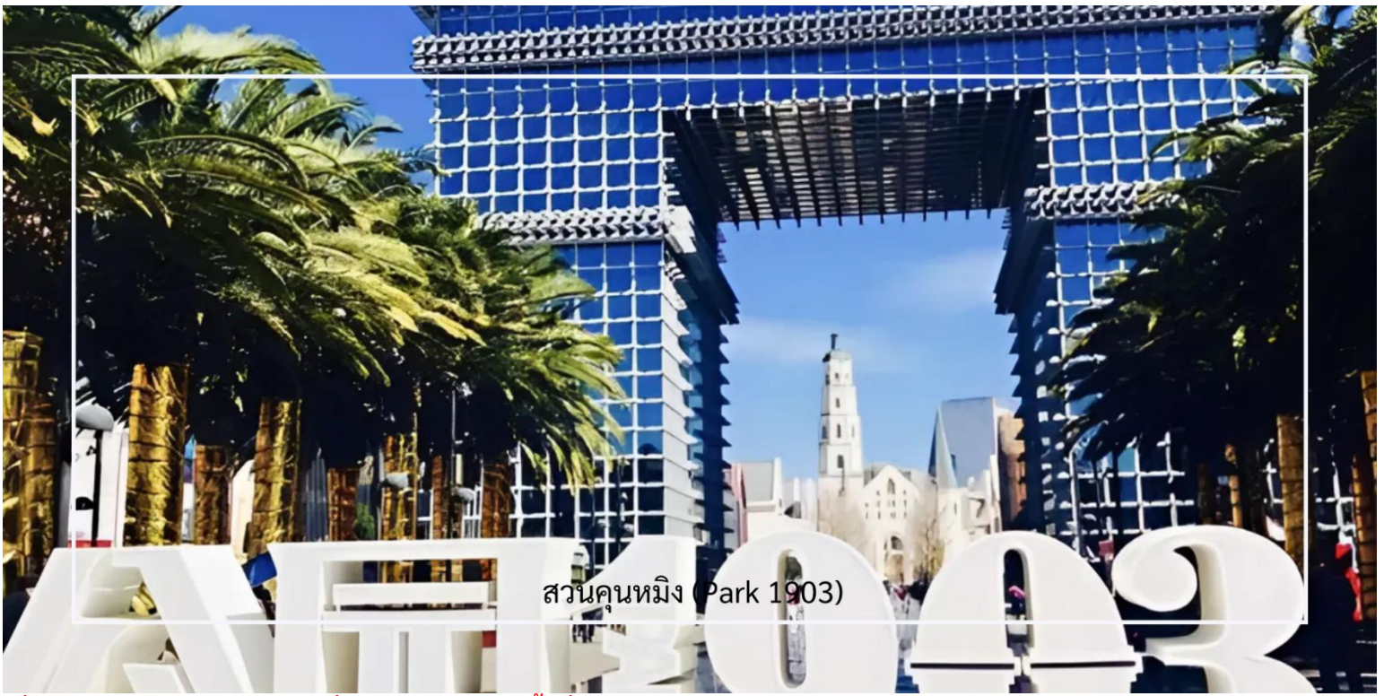
สวนคุณหมิง (Park 1903)