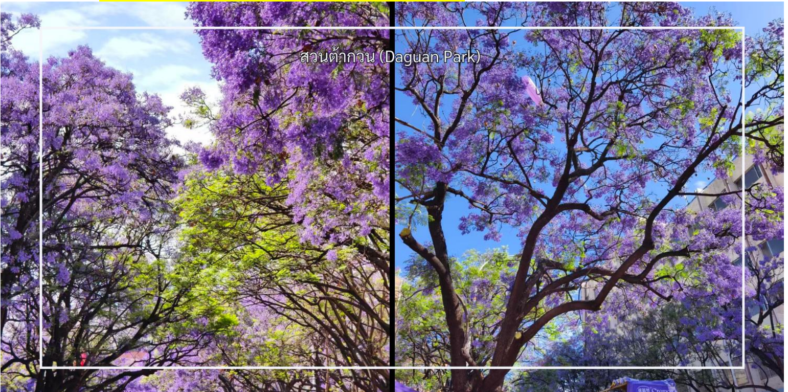
สวนต้ากวน (Daguan Park)

หมายเหตุ : การออกดอกของดอกไม้ในโปรแกรมท่องเที่ยวอาจแตกต่างกันไปในแต่ละช่วงเวลา ทั้งนี้ขึ้นอยู่กับสภาพอากาศและสภาพภูมิประเทศของพื้นที่ ณ วันเดินทางจริง ดอกไม้อาจยังไม่บานเต็มที่หรืออาจร่วงโรยแล้ว ทางบริษัทฯ ไม่สามารถรับประกันการออกดอกหรือความสวยงามของดอกไม้ได้