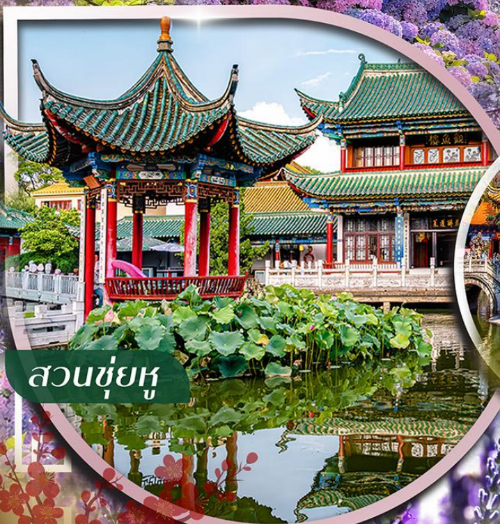
สวนชู่ฮู