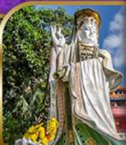
เจ้าแม่กวนอิม สวีลิสเบย์