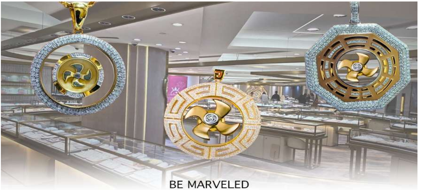
BE MARVELED ศูนย์ฮวงจุ้ย กัณฑ์เศรษฐี

และนำท่าน ชม ศูนย์ปี่เซี่ยะ ซึ่งคนจีนนั้น ถือว่าหยกเป็นหิน ที่เป็นตัวแทนของความสวยงามและความบริสุทธิ์มีความเชื่อว่า หยก มงคล ถ้าพกติดตัวไว้จะอายุยืนและสุขภาพดีมีสินค้ำมากมายเกี่ยวกับหยก อาทิ กำไลหยก หรือสัตว์นำโชคอย่างปี่เซี่ยะ ให้ ท่าน ได้เลือกซื้อเป็นของฝาก, ของที่ระลึก หรือของนำโชคแต่ตัวท่านเอง