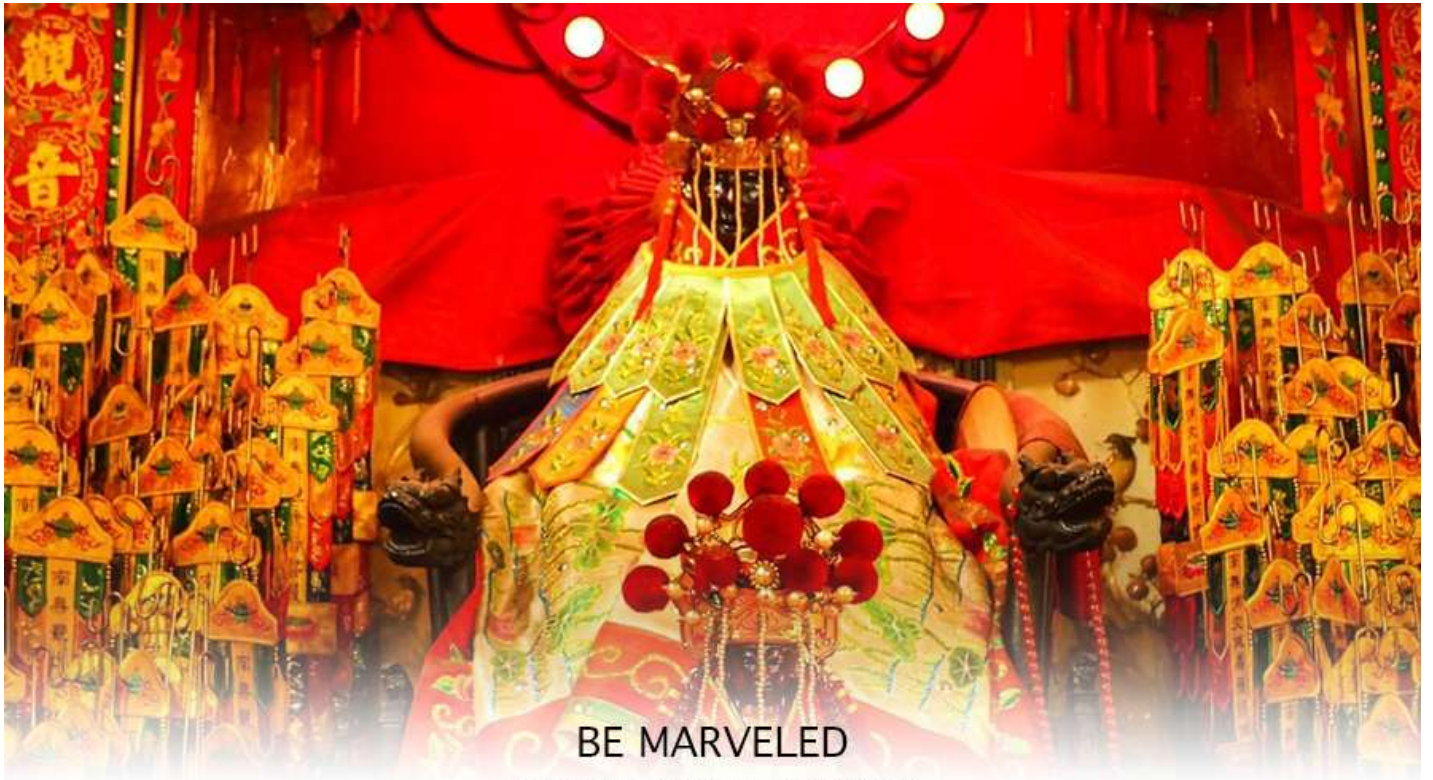
วัดเจ้าแม่กวนอิมฮวงอ่า (ยิมจิน)

หลังวันตรุษจีน ไป 26 วัน จะเป็นวันเปิดทรัพย์ที่จัดขึ้นในทุกๆปี พิธีนี้จะมีเพียงครั้งปีละครั้งเท่านั้น เป็นวันสำคัญอีกวันที่คน หลัง ไหลมาไหว้ขอพรอย่างไม่ขาดสาย