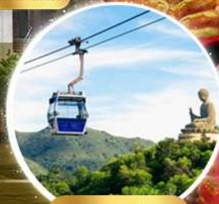
กระเช้าองปิง 360