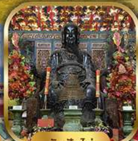
วัดปุกโต