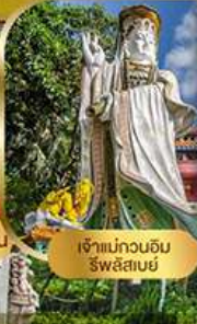
เจ้าแม่กวนอิม ริฟลิสเบย์