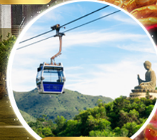
กระเช้าฮ่องกง 360