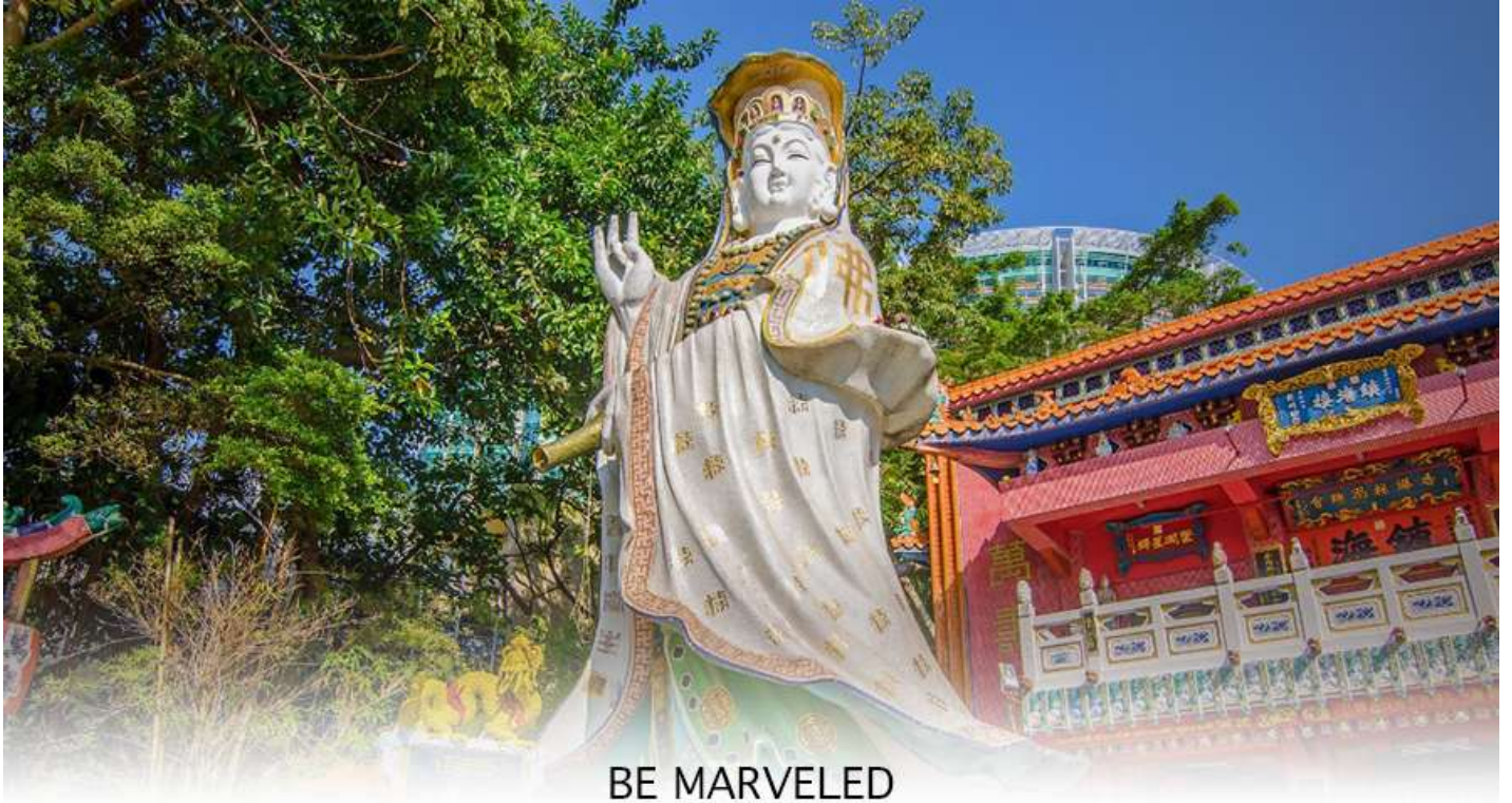
BE MARVELED วัดเจ้าแม่กวนอิมรีพัลส์เบย์

นักท่องเที่ยวนิยมนมาสักการะที่ วัดหินหัว อ่าวรีพัลส์เบย์ (TIN HAU TEMPLE REPULSE BAY) ซึ่งตั้งอยู่ริมทะเล เป็นสถานที่ท่องเที่ยวสำคัญ สร้างขึ้นในปี ค.ศ.1993 มีรูปปั้นของ เจ้าแม่กวนอิม ปางประทานพรตั้งอยู่ ซึ่งคนฮ่องกงและคนจีนให้ความเคารพนับถือมากที่สุด เชื่อว่าเป็นเทพที่มีความศักดิ์มากขอพรเรื่องงานการเงิน และขอพรขอโชคลาภเพื่อเป็นสิริมงคล และขอพร