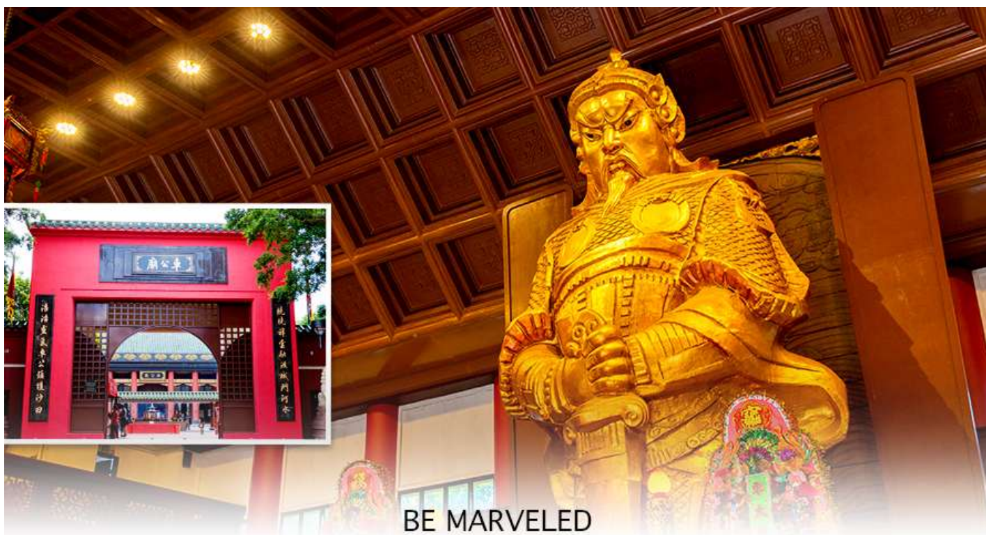
BE MARVELED วัดแชกง

นำท่านเดินทางสู่ วัดแชกงหมิว หรืออีกชื่อหนึ่งว่า “วัดกั๊กหันลม” หนึ่งในวัดดังของฮ่องกง ที่ประชาชนให้ความเลื่อมใสศรัทธามานาน ด้านในศาลจะมีรูปปั้นสูงใหญ่ของท่านแชกง ซึ่งเป็นเทพประจำวัดแห่งนี้ เชื่อ ว่าองค์ท่านศักดิ์สิทธิ์ในการขอพรด้านโชคลาภ เสริมความเป็นสิริมงคล บัดเป่าเรื่องร้ายๆออกไป และวัดแห่งนี้ยังเป็น สถานที่ที่นิยมสำหรับท่านที่ต้องการแก้ปีชงอีกด้วย โดยวิธีการไหว้ขอพรจากท่านแชกงนั้น ท่านจะต้องเข้าไปยืนอยู่เบื้อง หน้ารูปปั้นของท่าน แล้วอธิษฐานขอพรพร้อมกับมองหน้าท่านอย่างมุ่งมั่นตั้งใจ จากนั้นให้ท่านทำพิธีหม้อน “กั๊กหันแห่ง โชคชะตา” หรือ “กั๊กหันนำโชค” เพื่อหม้อนรับแต่สิ่งดีๆ ให้เข้ามาในชีวิต