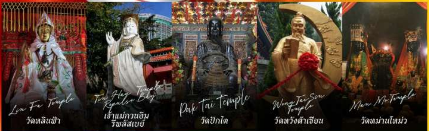
Lin Fa Temple วัดหลินฟ้า

รายการทัวร์ข้างต้นอาจมีการปรับเปลี่ยนเพื่อความเหมาะสม