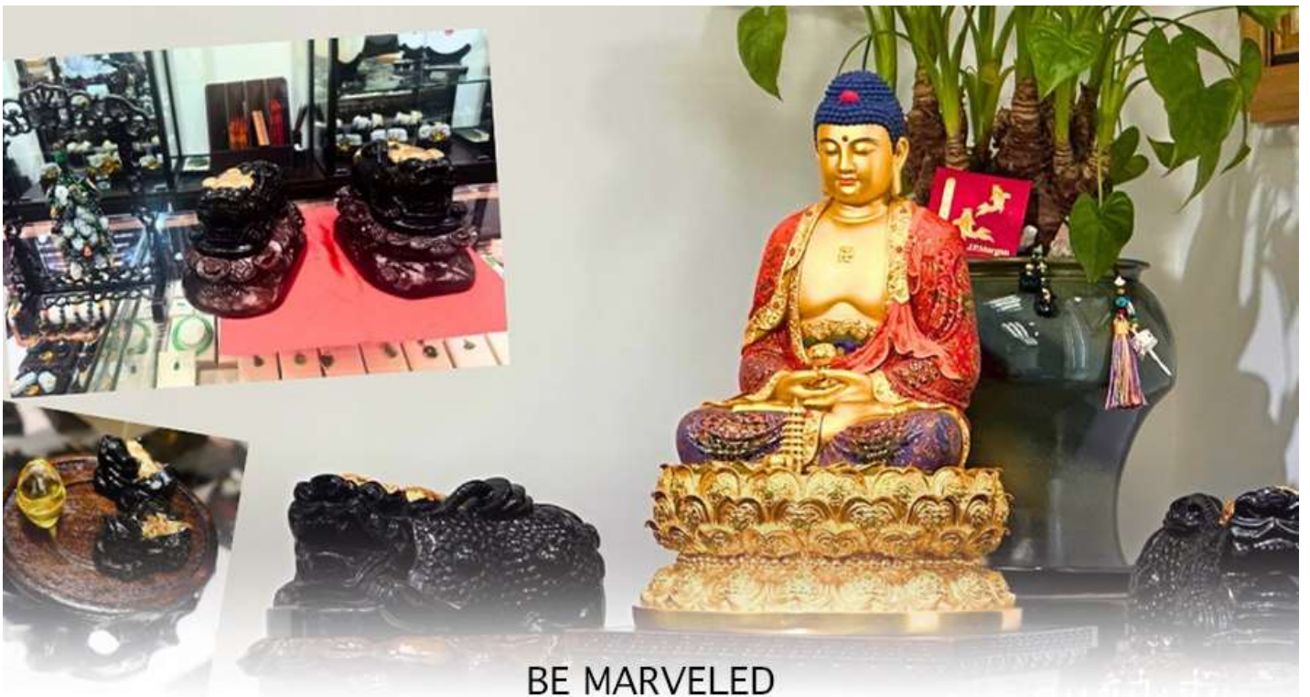
BE MARVELED ศูนย์ปี่เซี่ยะ

และนำท่าน ชม ศูนย์ปี่เซี่ยะ ซึ่งคนจีนนั้น ถือว่าหยกเป็นหิน ที่เป็นตัวแทนของความสวยงามและความบริสุทธิ์มีความเชื่อว่า หยก มงคล ถ้าพกติดตัวไว้จะอายุยืนและสุขภาพดีมีสินค้ำมากมายเกี่ยวกับหยก อาทิ กำไลหยก หรือสัตว์นำโชคอย่างปี่เซี่ยะ ให้ ท่าน ได้เลือกซื้อเป็นของฝาก, ของที่ระลึก หรือของนำโชคแต่ตัวท่านเอง