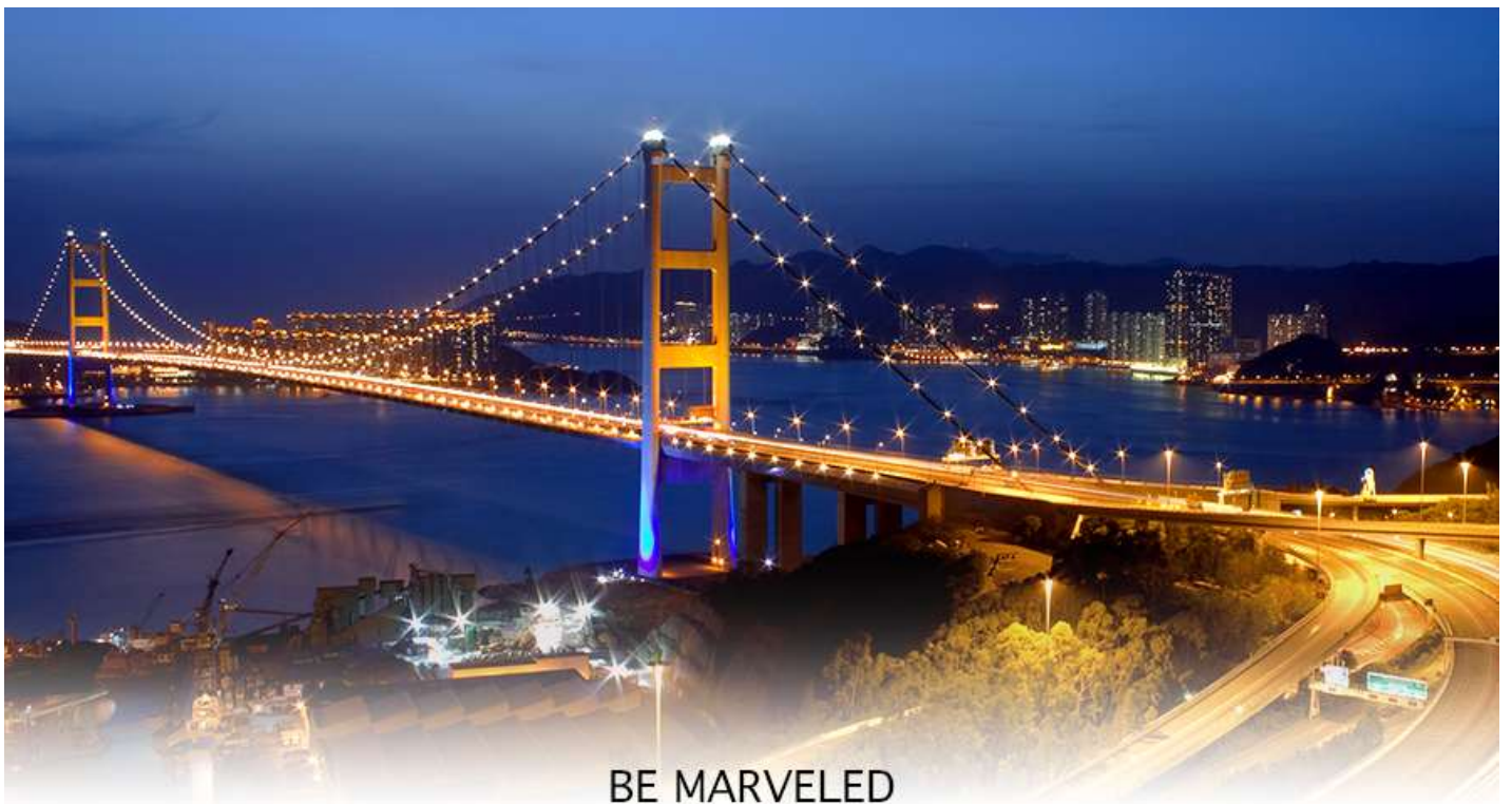
BE MARVELED สะพานแขวนฉิวหม่า