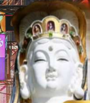
เจ้าแม่กวนอิม ริฟลิสเบย์