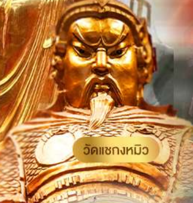
วัดเชกหงหิว