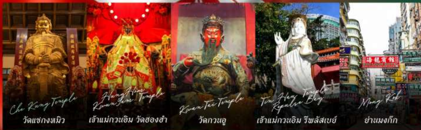
Che Kung Temple วัดแชกงงทมิว

รายการทัวร์ข้างต้นอาจมีการปรับเปลี่ยนเพื่อความเหมาะสม