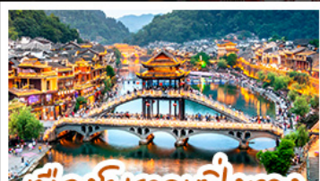
เมืองโบราณเฟิงเฉวง