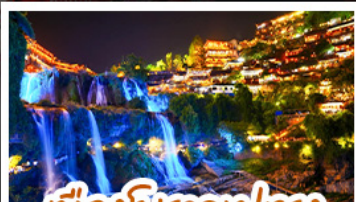
เมืองโบราณฝูเฉว่ง