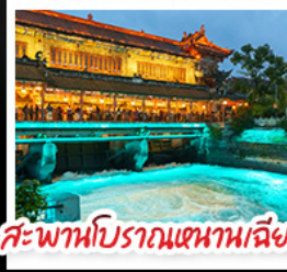
สะพานโบราณหนานเตี้ยว