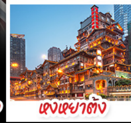
ตึกยุงหยาดัง