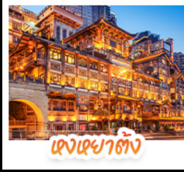
แดงเขยาดัง

สัมผัสใบไม้แดงสุดงดงามที่ อุทยานภูเขามังกร และ อุทยานทองอุ้ยซาน ชมวิวกลางคืนสุดอลังการที่ หงหยาดัง แลนด์มาร์กชื่อดังแห่งดงซิง สักการะพระโพธิสัตว์เจ้าแม่กวนอิม ณ วัดหลิงถวน ขอพรเสริมสิริมงคล เช็กอินแลนด์มาร์กสุดฮิต เพนด้าป็นตึก IFS + POP MART ช้อปบิงจู่ใจที่ ไถ่กูหลี่ ถนนคนเดินซุนซู่