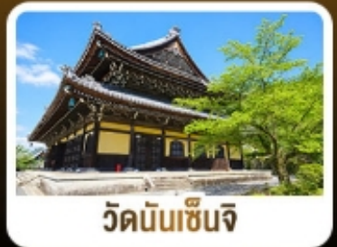
วัดนันเซ็นจิ