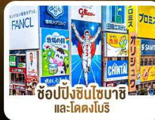
ช้อปปิ้งชินโซบาชิ และโดตงโมริ