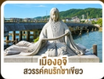
เมืองอิจิ สวรรค์คนรักชาเขียว