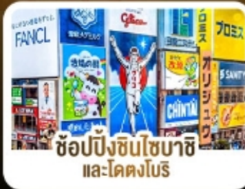
ช้อปปิ้งชินโซบาชิ และโดตงโมริ