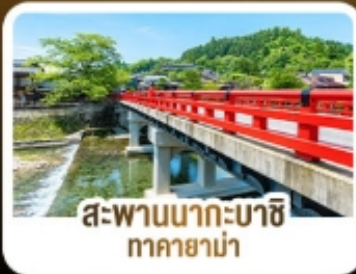
สะพานนากะบาชิ ทาคายาม่า