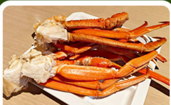
เมนูพิเศษ! ซาซิมิ

เกาะเอโนะชิมะ วิวสวยงามติด 1 ใน 100 ภูมิภาคญี่ปุ่น พร้อมชมปราสาทเจ้าคึกคิสิทธิ์ เที่ยวเต็มถึง 3 วัน แบบจุใจ ทั้งวัด ศาลเจ้า สวนดอกไม้ และช้อปปิ้ง