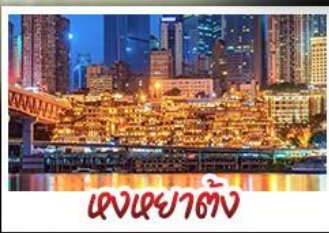
แดงเซาตั้ง