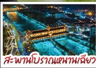
สะพานโบราณแหวนเฉียว