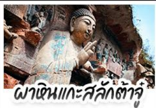
ผาหินแกะสลักต้าจู่