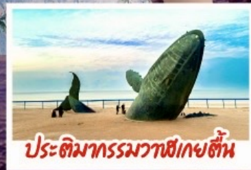
ประติมากรรมวาฬเกยตื้น