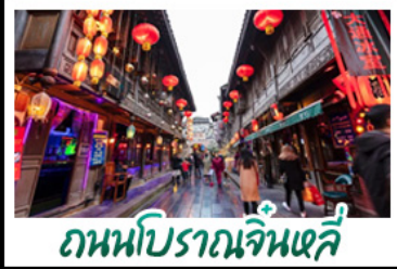
ถนนโบราณจินหลี่