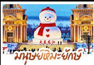
มนุษย์หิมะยักษ์