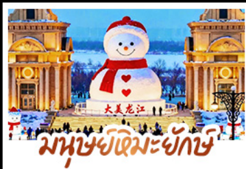
มนุษย์หิมะยักษ์