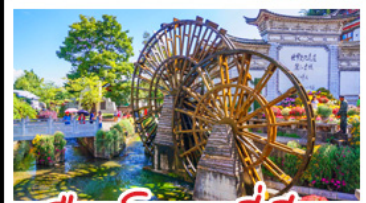
เมืองโบราณสี่เจียง