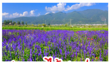
สวนดอกไม้ฮิวามูฉาง