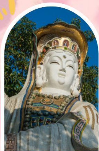
ริพลัสเบย์ รับพลังงานดี เสริมพลังอวงจู้ย