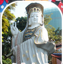
วัดเจ้าแม่กวนอิมรีพัลส์เบย์