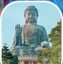
พระใหญ่โป่วหลิน