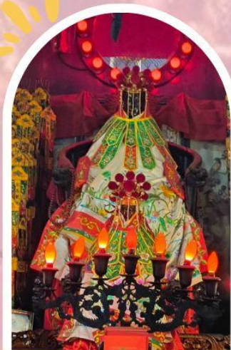
วัดเจ้าแม่กวนอิมฮ่องกง ขอพรเรื่องเงิน ทรัพย์สิน และความมั่งคั่ง