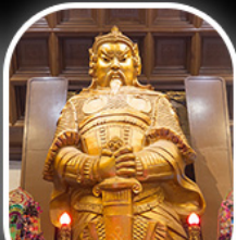
วัดเข่งหมิว