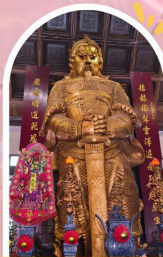
วัดแซกง ขอพรโชคกลาง การเงิน และธุรกิจ