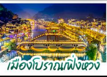
เมืองโบราณฝิ่งเซว่ง

ล่องเรือมังกรชียนซานกังสุ่ย - เมืองโบราณฝูหลงเจิน สะพานซื่อจื่อกวน - ไร่ชาอู่เจียโก