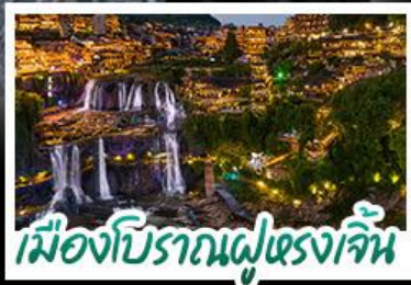
เมืองโบราณฝูหลงเจิน