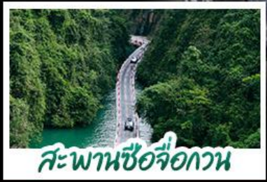
สะพานซื่อจื่อกวน