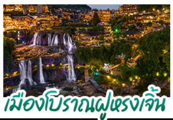
เมืองโบราณฝูหลงเจิน