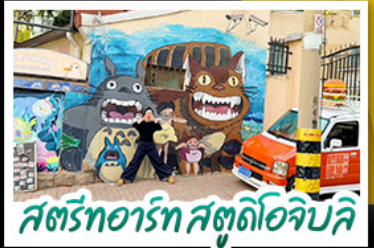
สตรีทอาร์ต สตูดิโอจิบลิ