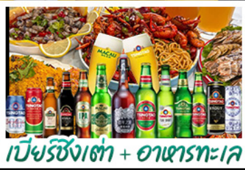
เบียร์ชิงเต่า + อาหารทะเล