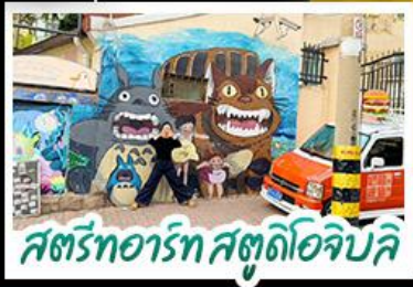
สตรีทอาร์ต สตูดิโอจิบลิ