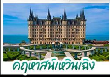
คฤหาสน์เหวินเจิง

เมืองเก่าชิงเต่า - คฤหาสน์เหวินเจิง เบียร์ชิงเต่า + อาหารทะเล สตรีทอาร์ต สตูดิโอจิบลิ