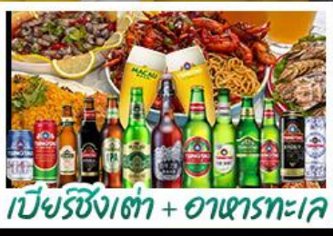
เบียร์ชิงเต่า + อาหารทะเล