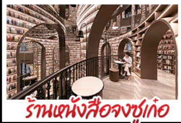
ร้านหนังสือจชชู่เก้อ