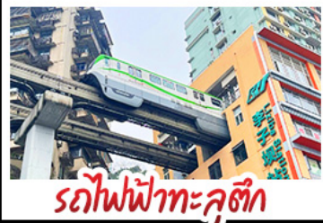
รถไฟฟ้าทะเลสาบ

ภูเขาสัตว์ชนิดนี้ - อุทยานหลุมฟ้าสะพานสวรรค์ อุทยานป่าเผิงโกว - หนีแพนด้าป็นตึก IFS รถไฟฟ้าทะเลสาบ - หงหยาดังวิวกลางคืน ร้านหนังสือจชชู่เก้อ - POP MART เมมูพิเศษ สุกี้หม้อไฟหมาล่า