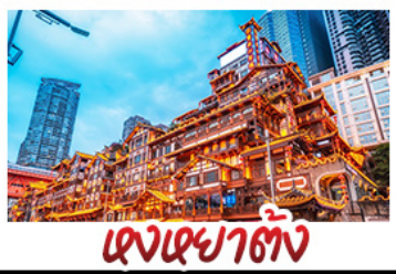
เขงเขาตัง