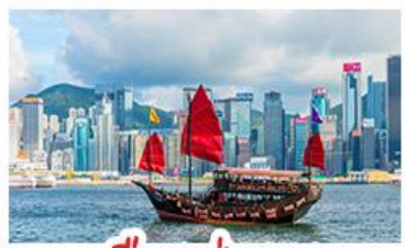
เมืองฮ่อกง

เมืองเก่าชิงเต่า - วิวเมืองฮ่อกง โรงเบียร์ชิงเต่า - ท่าเรือชาวประมงเยียนไถ