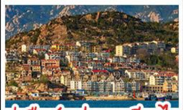
ท่าเรือชาวประมงเยียนไถ