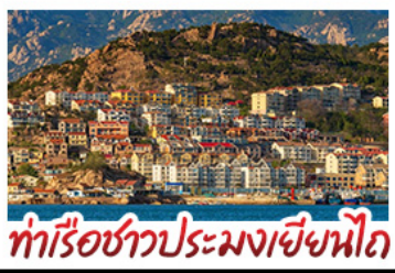
ท่าเรือชาวประมงเยียนไถ