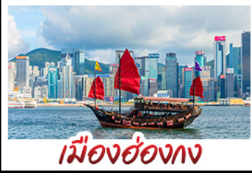
เมืองฮ่องกง

เมืองเก่าชิงเต่า - วิวเมืองฮ่องกง โรงเบียร์ชิงเต่า - ท่าเรือชาวประมงเยียนไถ