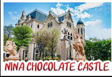
NINA CHOCOLATE CASTLE

ทะเลสาบสุริยันจันทรา - ไทเป 101 จิวเฟิ่น - NINA CHOCOLATE CASTLE MONSTER VILLAGE - ชิเหมินต้ง เมนูพิเศษ ปลาประรานาอินดี เซี่ยวหลงเปา / ซาบูไต้หวั่น