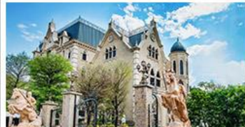
NINA CHOCOLATE CASTLE