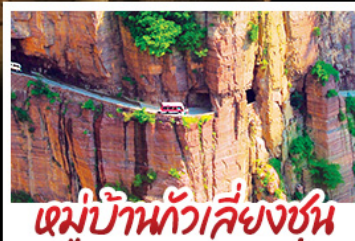
หมู่บ้านทิวาลัยขุม