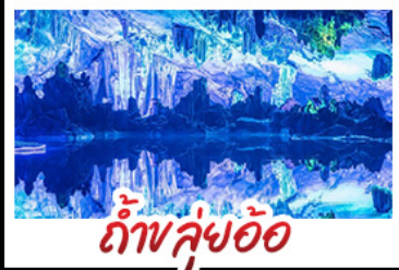
ถ้ำหลุย้อ