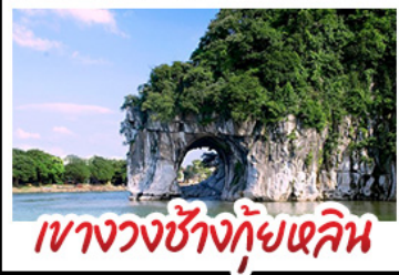
เขาวงกตช้างก๊วยหลิน