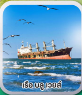
เรือ บลูเวสต์