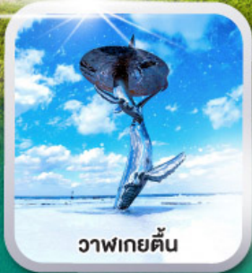
วาฬเกยตื้น