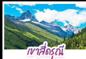
เขาสี่ดรุณี