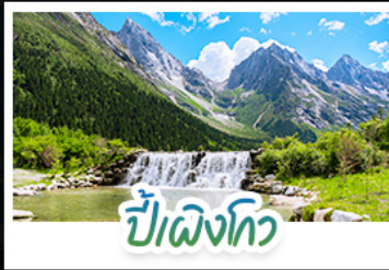
ปีติงโกว