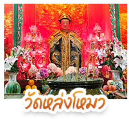
วัดเล่งโงมว

นั่งรถรางพืดแถมสู่ TOP OF PEAK • ซ้อมบั้งจุใจมกติก และ CITYGATE OUTLAETS • นั่งกระช้านองปิง สักการะพระใหญ่เทียนถาน • จอพรเจ้าแม่หล่งโหมว แม่ทอง 5 มังกร ให้ประสบความสำเร็จในทุกๆ ด้าน