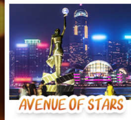
AVENUE OF STARS