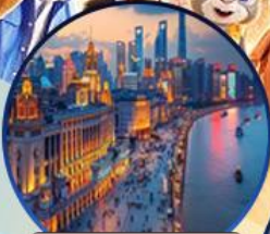
หาดไวทาน