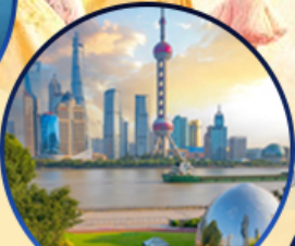
นอร์ทบัน กรีนแลนด์