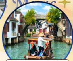
เมืองโบราณจูเจียเจีย