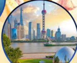
นอร์ทปิ่น กรีนแลนด์