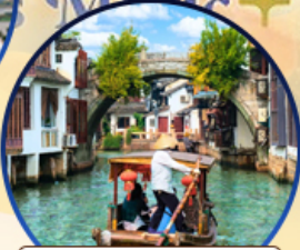
เมืองโบราณจูเจียเจีย