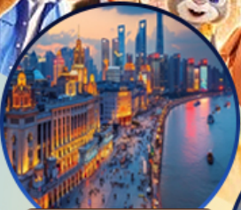
หาดไต้หวัน

สนุกจุใจ เชียงไฮ้ ดิสนีย์แลนด์ ฟรีเดย์ 1 วัน