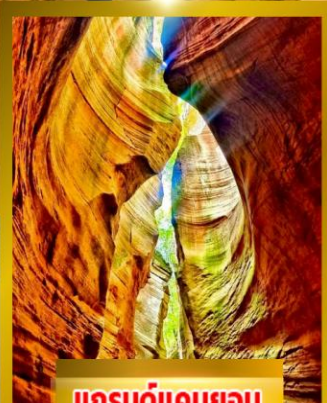
แกรนด์แคนยอน ยูวาโก