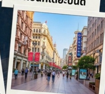
ช้อปปิ้งถนนนานจิง