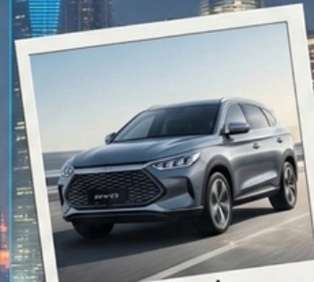
รถรับ-ส่ง สนามบิน-โรงแรม-สนามบิน