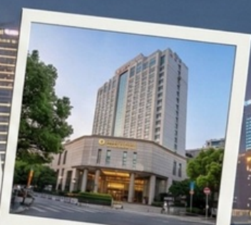
พักรู 4 ดาว City Hotel shanghai 3 คืน

Special Option : ตั๋ว Disneyland + รถรับ-ส่ง เริ่มต้นที่ 3,900 บาท/ท่าน