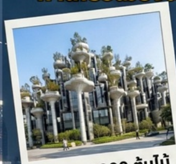
อาคาร 1000 ต้นไม้