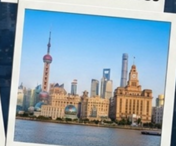
เข็ควินที่เดอะบันด์