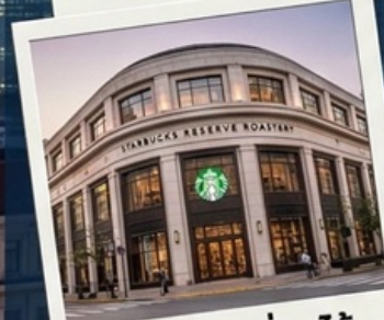
สตาร์บัคเซี่ยงไฮ้