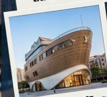
เข็ควินเรือหลุยส์วิทอง