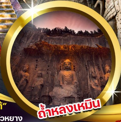
ถ้ำหลงเหมิน

สัมผัสความยิ่งใหญ่ของ "กองทัพจีนซีฮ่องเต้" ชม 'ถ้ำหลงเหมิน' มรดกโลกสุดยิ่งใหญ่แห่งลั่วหยาง เจดีย์ห้าพันป่าใหญ่ ตำนานพระถังซัมจั๋ง ช้อปปิ้งตลาดมุสลิม