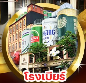
โรงเบียร์