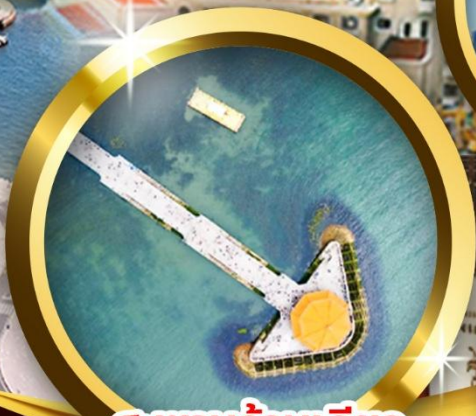
สะพานจันเจียว