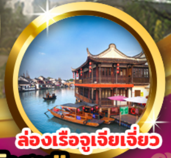
ล่องเรือจูเจียเจี้ยว