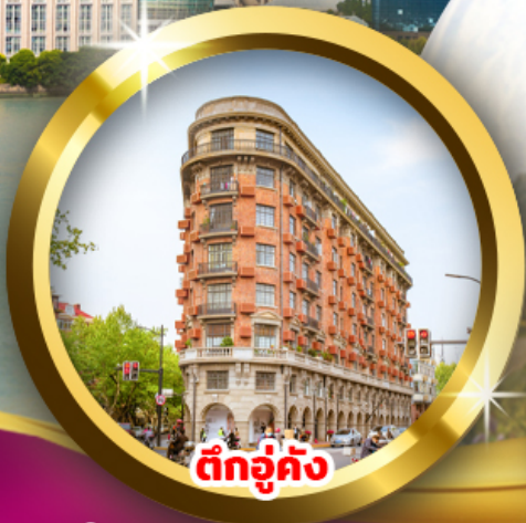
ตึกคู่ต้ง