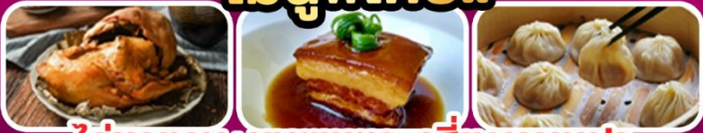
ไก่ขอกาน+หมูตุ๋นพะ+เสี่ยวหลงเปา