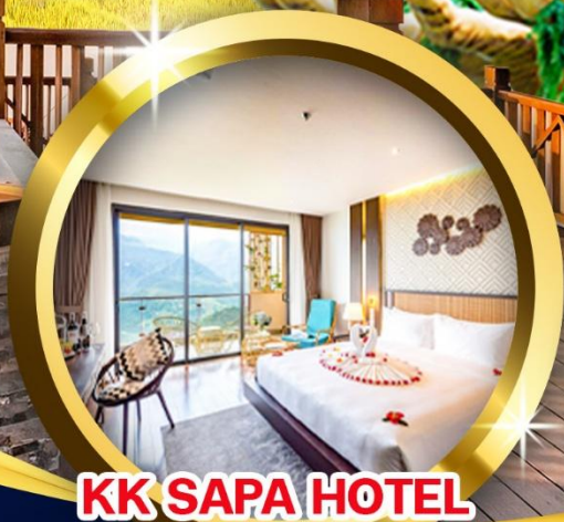
KK SAPA HOTEL วิวภูเขา 180 องศา