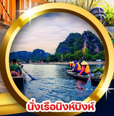
นั่งเรือนิงห์บิงห์